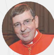
Hồng Y Kurt Koch Chủ tịch Hội Đồng Giáo Hoàng Cổ Vũ Hiệp Nhất Ki-tô Giáo

"Tôi rất vui vì những người sau khi hoàn tất khoá đào tạo Alpha đã được đưa về cộng đồng giáo xứ để đảm nhận một vai trò tích cực mà họ chưa từng nắm giữ trước đó."