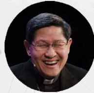
Hồng Y Luis Antonio Tagle,

"Nhiều giáo xứ trong Tổng giáo phận Detroit đã nhận thấy Alpha là một công cụ tuyệt vời để giúp những người nam, người nữ nghe được lời rao giảng Tin Mừng đầu tiên. Tôi rất vui vì việc sử dụng Alpha cho các nhân viên của tổng giáo phận đã mời gọi được một sự cam kết mới đối với những chân lý cơ bản của Tin Mừng."